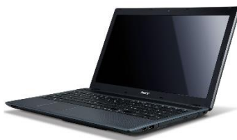
PC & Notebook