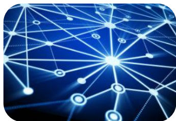
Reti & Server