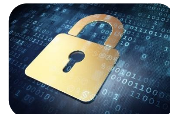
Sicurezza & Privacy